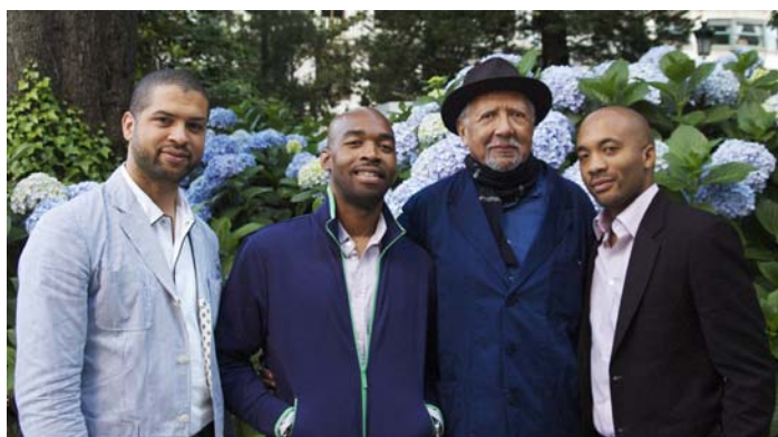
Jason Moran, Eric Harland, Charles Lloyd, Reuben Rogers

Un quartet de rêve : le saxophoniste Charles Lloyd , le pianiste Jason Moran , le bassiste Ruben Rogers et le batteur Eric Harland . Charles Lloyd fut d'abord influencé par John Coltrane et repéré avec les fulgurants « Discovery ! » et « Of Course » en 1965. Son premier quartet avec Keith Jarrett, Jack DeJohnette et Cecil McBee et l'album « Charles Lloyd at Monterey » (1966) sont salués par la critique ! Ses disques mêlent alors improvisations avant-gardistes et musiques traditionnelles (indiennes surtout). Après une longue éclipse, Charles Lloyd réapparaît avec Michel Petrucciani, puis un nouveau quartet avec lequel il publie « Fish Out of Water » (1989), ou bien encore « The Water Is Wide » avec Brad Mehldau (2000). Après « Rabo de Nube » avec Jason Moran (2008), il tourne aujourd'hui avec le quartet de son nouvel album « Mirror », le treizième pour ECM. Toute une histoire du jazz des 40 dernières années.